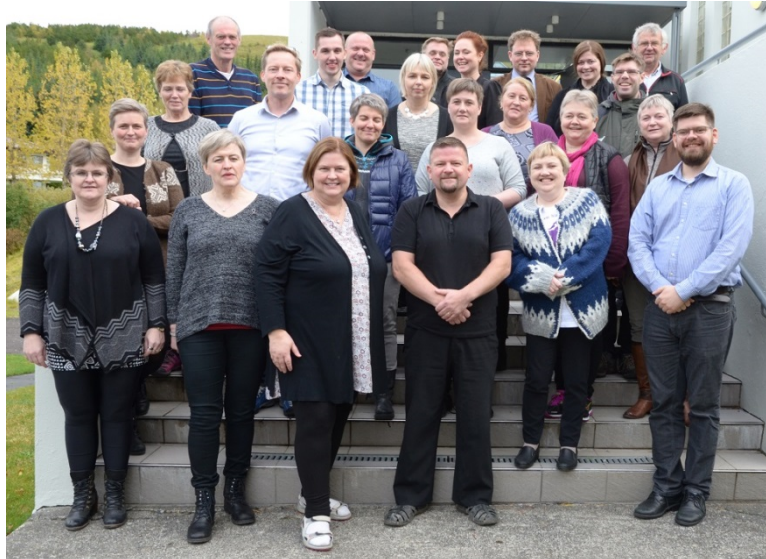
Þátttakendur á ráðstefnu skjalavarða á Húsvík.