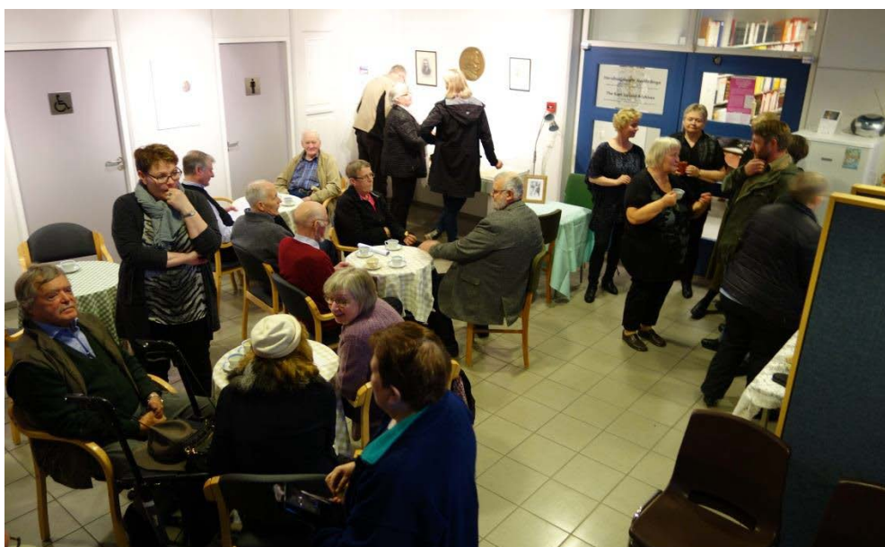
Rúmlega 40 gestir mættu á Sigfúsarvöku og opnun sýningar um hann.

31. október var opnuð sýning í tilefni af því að 160 ár voru liðin frá fæðingu Sigfúsar Sigfússonar þjóðsagnaritara frá Eyvindará. Sýningin, sem var samstarfsverkefni Héraðsskjalasafns, Minjasafns Austurlands og Bókasafns Héraðsbúa, var opnuð í lok Sigfúsarvöku þar sem fjallað var um ævi Sigfúsar auk þess sem þjóðsögur, sagnir og ljóð úr safni hans voru flutt á fjölbreyttan hátt. Á sýningunni voru veggspjöld um lífsstarf Sigfúsar, ljósmyndir af honum, skjöl með rithönd Sigfúsar og í tölvu var hægt að skoða kort af Austurlandi og hlusta á þjóðsögur frá völdum töldum. Verkefnið var styrkt af Alcoa Fjarðaáli og Ússuhópnum.