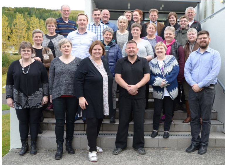
Þátttakendur á ráðstefnu skjalavarða á Húsvík.