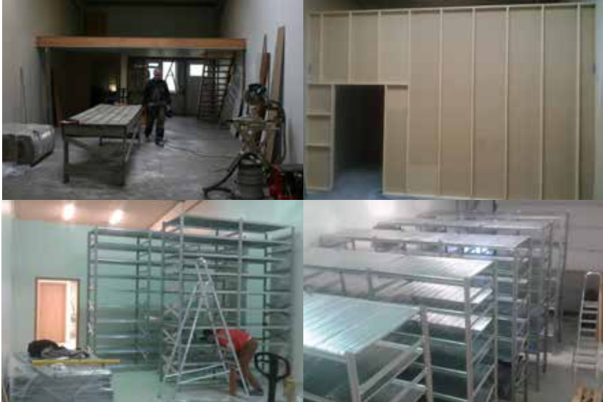
Skjalageymsla Héraðsskjalasafnsins að Háheiði á ýmsum stigum innréttinga og breytinga sem gerðar voru á húsnæðinu. Reikna má með því að geymslan taki um 500 hillumetra af skjölum sem samsvarar u.þ.b. því magni skjala sem safnið tekur á móti næstu 10 ár.